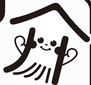
熟年相談室イメージキャラクター 「い〜かいごくん」